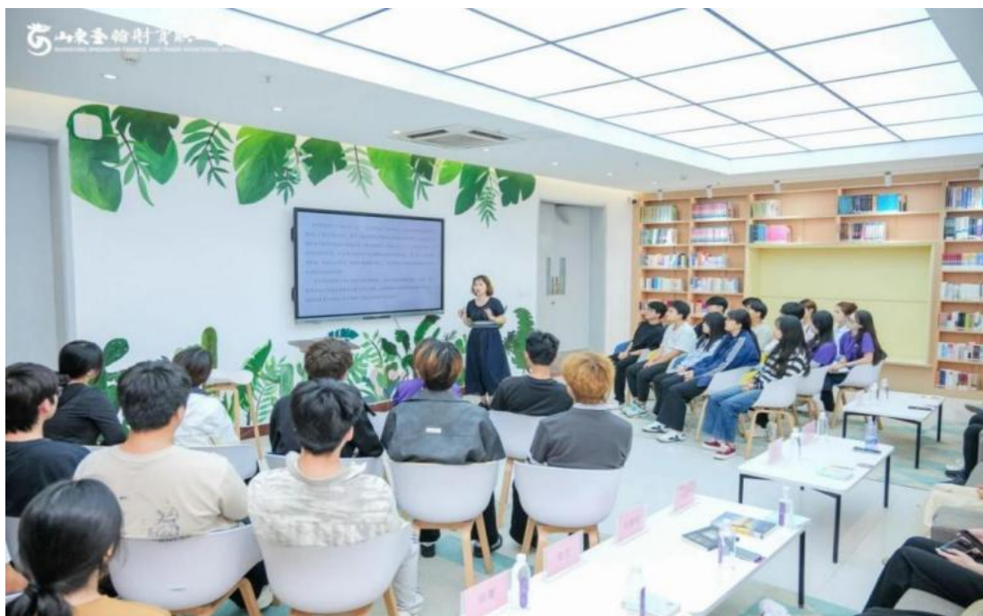
图 1-18 “泉漾书声，玫语润心”读书分享会

该活动是图书馆打造的常态化校园阅读品牌，紧扣高职教育“知行合一”育人特色，以“搭建阅读分享平台、树立校园阅读典范”为目标，聚焦学生职业成长与综合素养提升。活动特邀校内优秀教师担任主讲嘉宾，精选历史、文学、艺术、心理学等多元领域书籍，采用“主讲解读+现场互动”模式，变“单向灌输”为“双向共鸣”；为主讲嘉宾颁发“优秀阅读推广大使”荣誉证书，形成“教师引领、学生参与”的良好氛围。