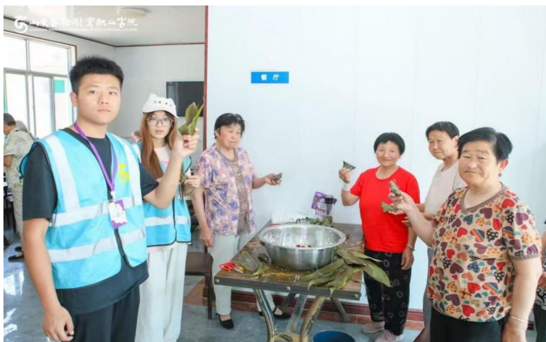
图 2-2 端午志愿服务活动

2025 年 5 月 30 日，学校社团联合会、青年志愿者协会组织学生志愿者赴长清区平安街道前朱村村委会活动中心，开展“粽叶飘香迎端午，青春志愿暖人心”活动。志愿者为村民带来歌曲演唱、舞蹈表演、诗歌朗诵等文艺节目，与老人共同包粽子，感受端午气氛。活动丰富了乡村老年人的精神文化生活，促进了大学生与乡村的交流互动，增强了大学生社会责任感与实践能力。