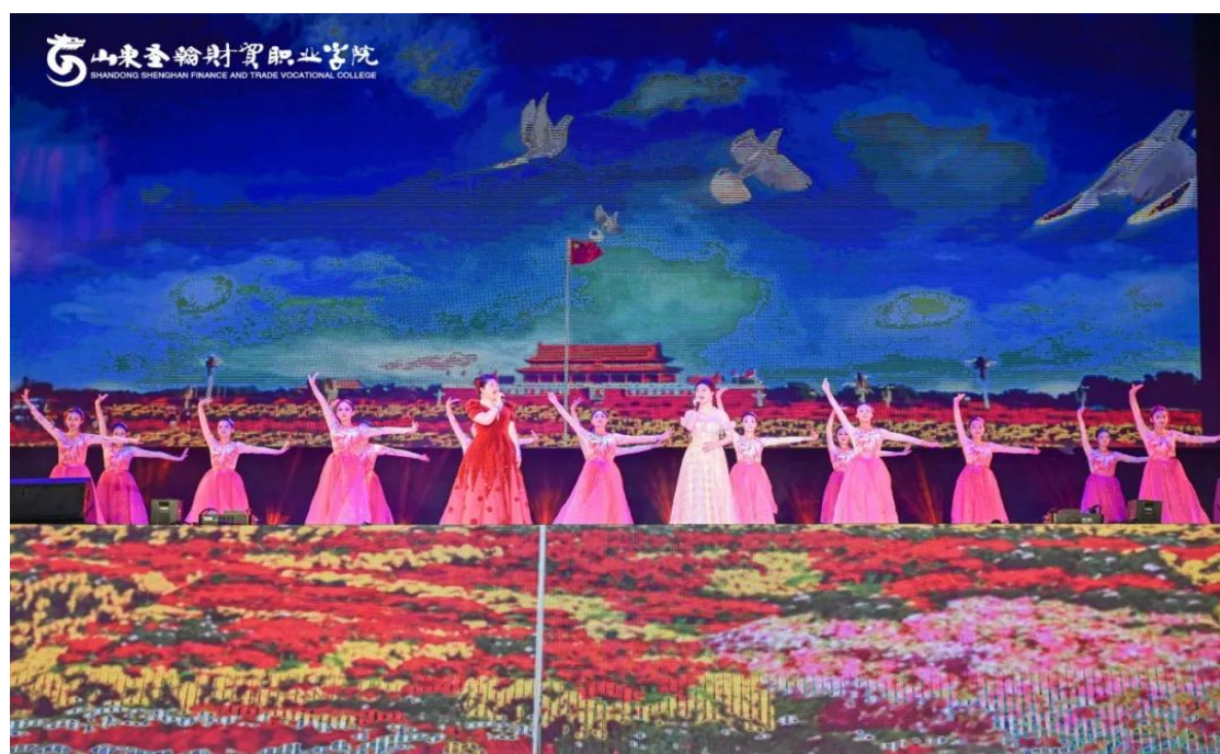
图 1-4 “韶华圣志 翰梦新章”专业汇报晚会

2025年6月10日—11日,学校主体育场举办“韶华圣志,翰梦新章”专业汇报晚会。舞蹈场以“溯光·湍流·共生”为主题,舞蹈专业学生展现对艺术的执着追求与传承创新;综合场节目形式丰富,涵盖传统文化创新演绎与现代艺术碰撞,以艺术语言诠释对传统文化的传承、家国情怀的坚守与创新精神的追求。