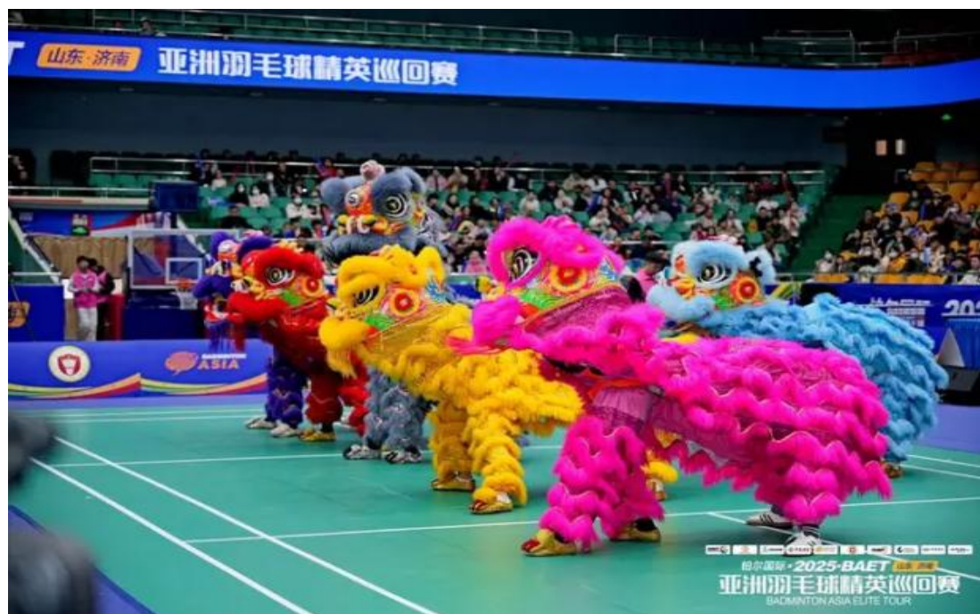
图 3-8 舞龙舞狮协会

优化信息表，构建“制度保障+精准服务+成效考核”的社团管理体系。通过多维度优化改革，定期召开社团联合会工作部署会议、社团负责人座谈会，听取社员意见建议，稳固社团组织架构，提升运行效率。2025 年，学校共有注册社团 36 个，年均开展活动 100 余场，累计参与人数达 7000 余人。