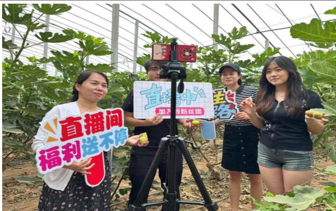
图 1-7 电商直播实战项目

云商传媒学院以行业需求为导向，深耕课程创新与改革，依托真实商业项目搭建实训平台，开展“平阴县玫瑰花电商直播节”“佳宝牛奶次日达电商实战”等项目实践。学生全程参与选品、策划、直播执行、数据复盘等完整流程，通过“课堂即直播间、学习即实战”的沉浸式教学模式，实现理论知识与行业实践深度融合，提升岗位适配力与就业竞争力。