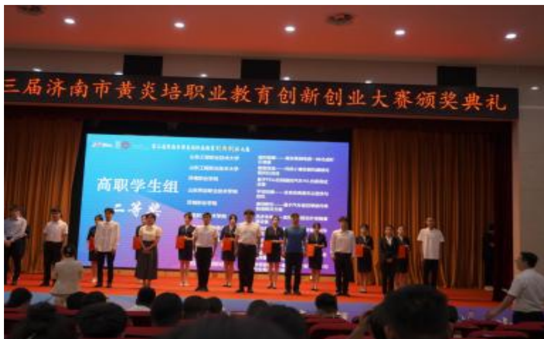
图 1-22 创新创业大赛颁奖典礼

2025 年 4 月—8 月，组织近万名学生参加山东省大学生创新大赛，上报基础项目 4100 个，推荐 11 个重点项目至省赛，商学院“花沐园艺青创农场——00 后新农人‘花卉+养殖+文旅’的融合实践”项目获铜奖。