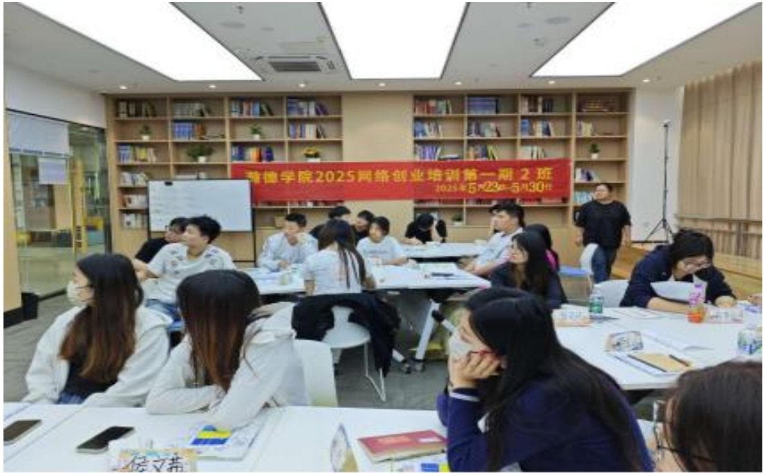
图 1-21 创新创业学院组织开展 2025 年第一期网络创业培训班

融合和教育教学改革，加强创新创业培训过程与质量管理。2025年，创新创业学院开展创业意识培训、网络创业培训，参训学生150人次，141人通过考试并获山东省职业技能培训合格证书，培训合格率94%。