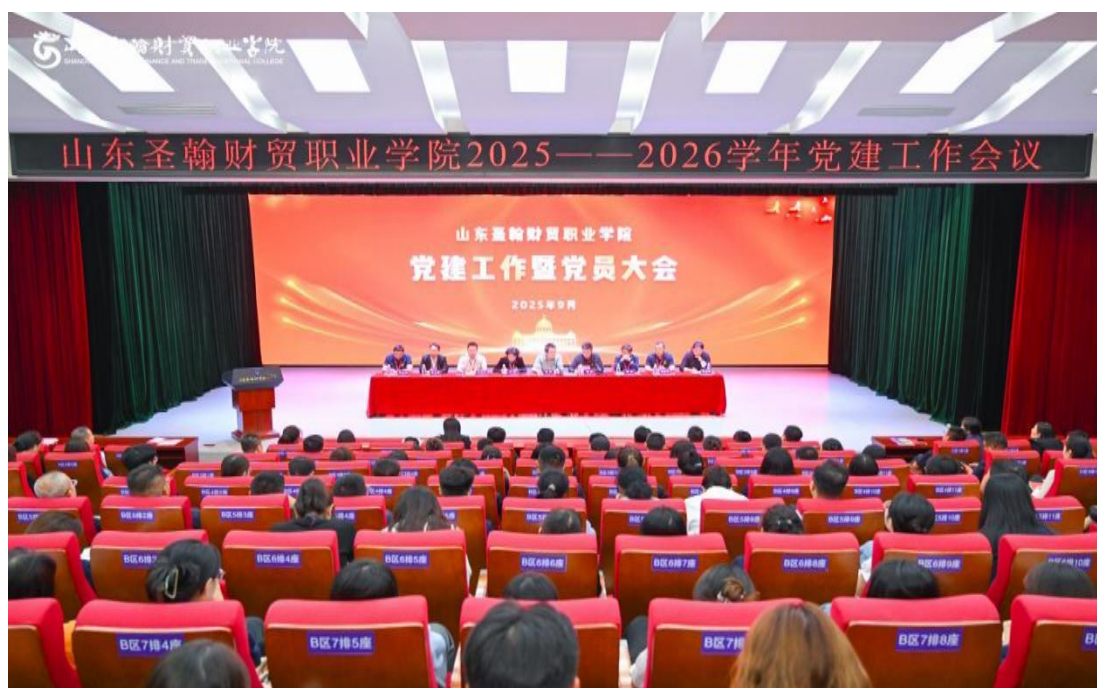
图 6-2 学校党建工作暨党员大会