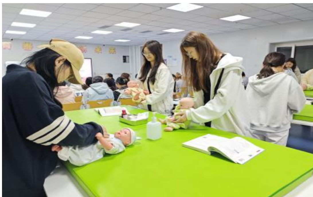
图 6-4 《婴幼儿伤害预防与处理》课堂实训

《婴幼儿伤害预防与处理》课堂围绕保育师证书考核核心要求，结合婴幼儿生理发育特点，系统讲解婴幼儿心肺复苏术（CPR）、烧烫伤急救处理、外伤出血包扎等关键技能要点。实践环节采用“理论讲解—示范操作—分组实训—纠错提升”闭环教学模式，学生以小组为单位分工协作，沉浸式开展实操训练。课程以山东省“技能兴鲁”职业技能大赛—妇幼健康职业技能竞赛为导向，对接婴幼儿照护岗位，将育婴员证书考核标准融入教学全过程，实现岗、课、赛、证深度融合。