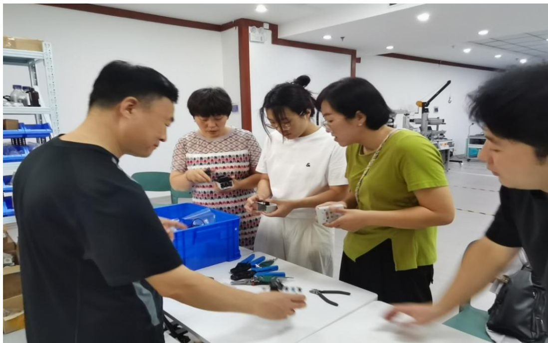
图 5-1 共达电声企业专家与学院教师进行交流学习

学校聚焦地方智能装备、电子信息等主导产业，与共达电声股份有限公司深度合作，通过订单班模式构建“校企共育”生态，精准回应产业人才需求与职业教育改革方向。订单班通过“企业导师+真实场景+技能认证”三重路径，系统提升学生职业竞争力。企业导师驻校授课：讲授《电声设备测试技术》《智能产线运维》等企业特色课程 10 门，将行业前沿技术、岗位实操经验直接传递给学生，涉及 40 个班级，学生参与学习 4000 余次；真实生产场景实训：学生在共达电声实训基地参与“智能产线调试”“电声设备质量检测”等 30 余项，模拟企业生产全流程，强化实践能力；岗位技能认证：联合企业开发“电声设备调试师”“智能产线运维员”等岗位技能认证标准 20 余个，学生通过认证后直接获得企业认可的“上岗资质”，实现“技能培养-岗位实习-优质就业”闭环。