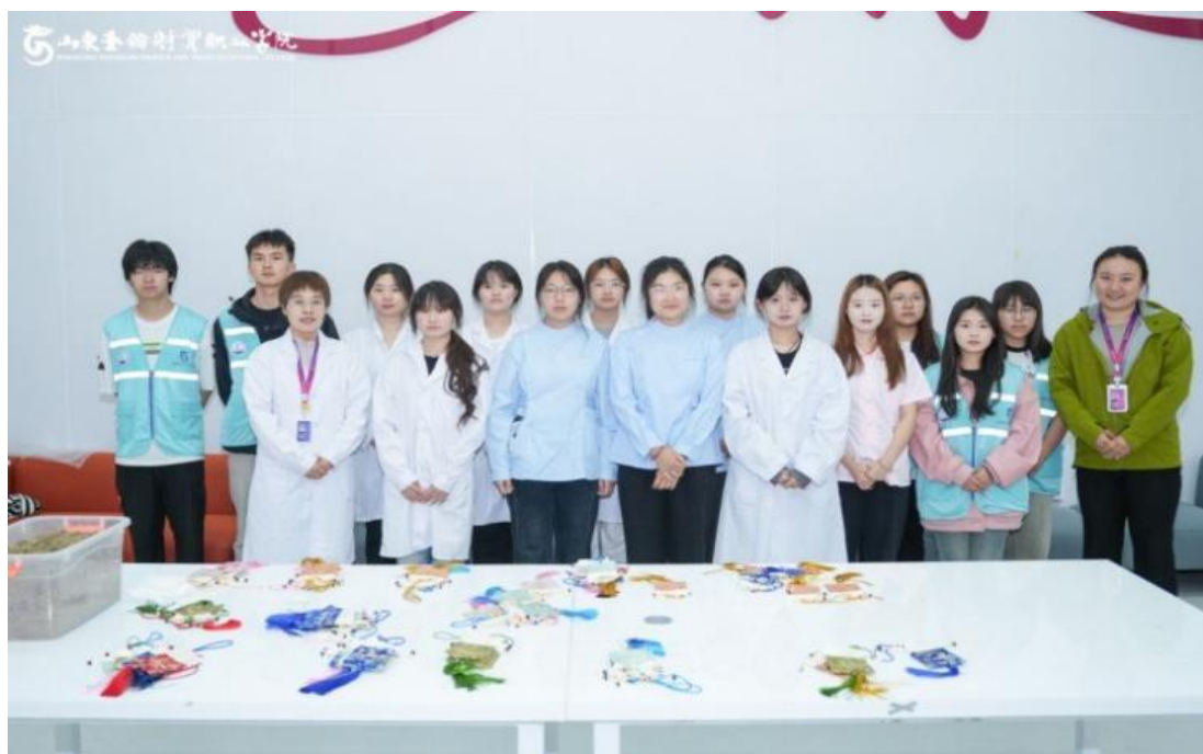
图 1-14 学生参加“资助育人·暖心助眠香囊”特色项目

依托健康学院专业优势，“π 行动”社团开展“资助育人·暖心助眠香囊”特色项目。项目以中医药文化为载体，组织贫困学生在专业教师指导下，配制含艾叶、薰衣草、合欢花等安神助眠功效的中药香囊，将传统医学知识融入实践育人。活动累计制作香囊 300 余个，部分作为“健康关怀包”赠予受助学生，部分在校内公益义卖，所得收益用于后续资助实践，构建“自助—互助—助人”良性循环，增强资助育人的温度与实效性。