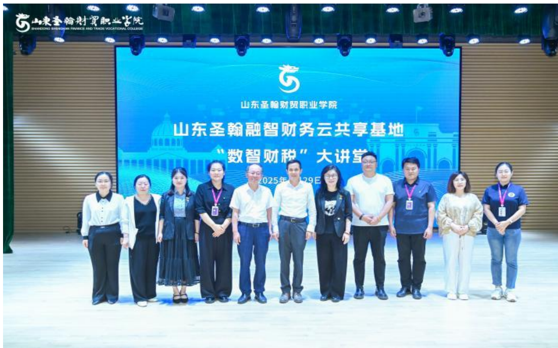
图 3-2 学校举办“数智财税大讲堂”