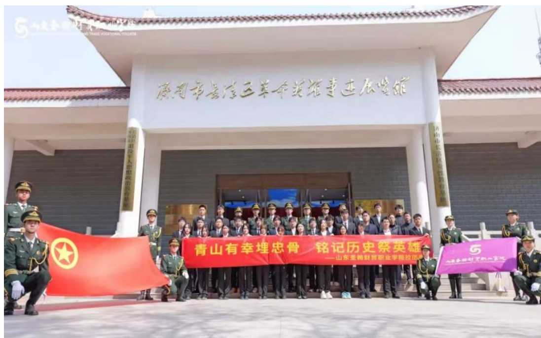
图 1-3 清明祭扫实践活动

2025 年 4 月 4 日，学校组织师生赴长清区石麟山烈士陵园开展清明缅怀先烈活动，通过敬献花篮、瞻仰纪念碑、参观纪念馆等形式，接受红色教育、传承革命精神、厚植爱国情怀。活动让志愿者汲取崇高革命精神，凝聚爱国力量，转化为奋斗激情，助力学生在学习工作中继承先烈遗志、砥砺前行。