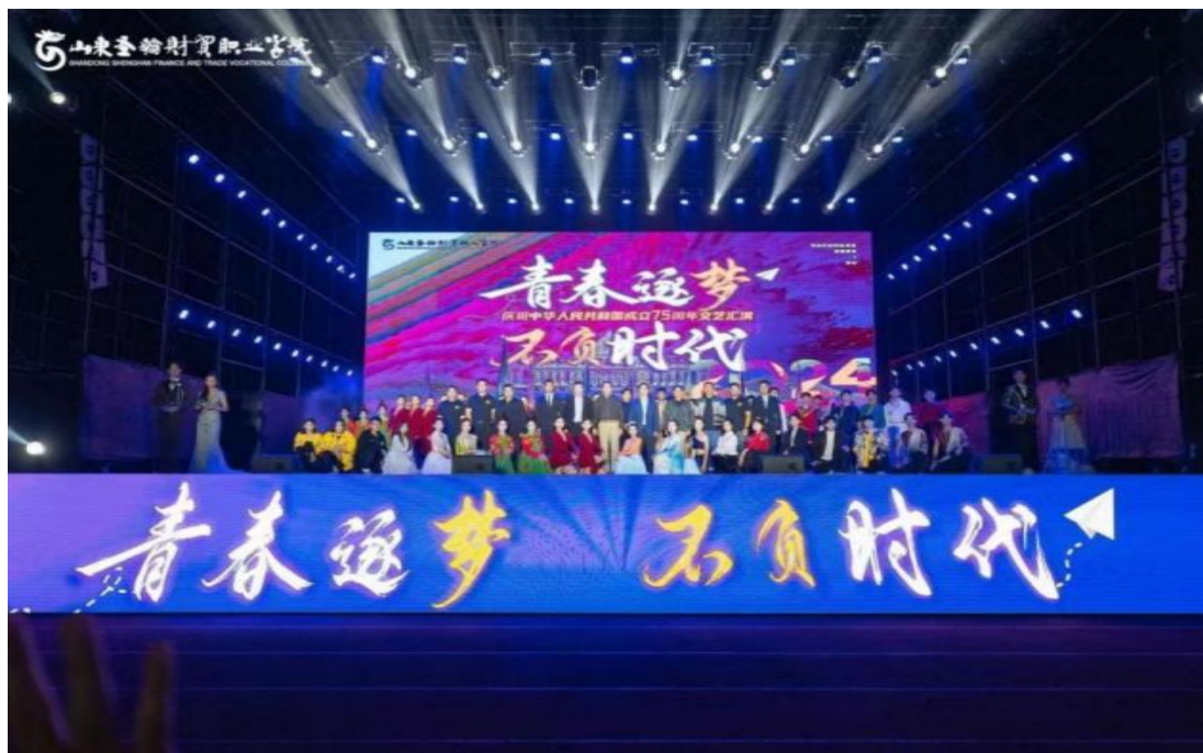
图 1-13 庆祝中华人民共和国成立 75 周年文艺汇演

学校主体育场举办庆祝中华人民共和国成立 75 周年文艺汇演。晚会融合国家华诞庆祝与新生迎接双重主题，师生呈现了深情朗诵、悠扬歌声、动感舞蹈、精湛乐器演奏等精彩纷呈的节目，既彰显了对祖国的热爱，又传递了对新生的祝福，展现了学校文化底蕴与对青年全面发展的重视。