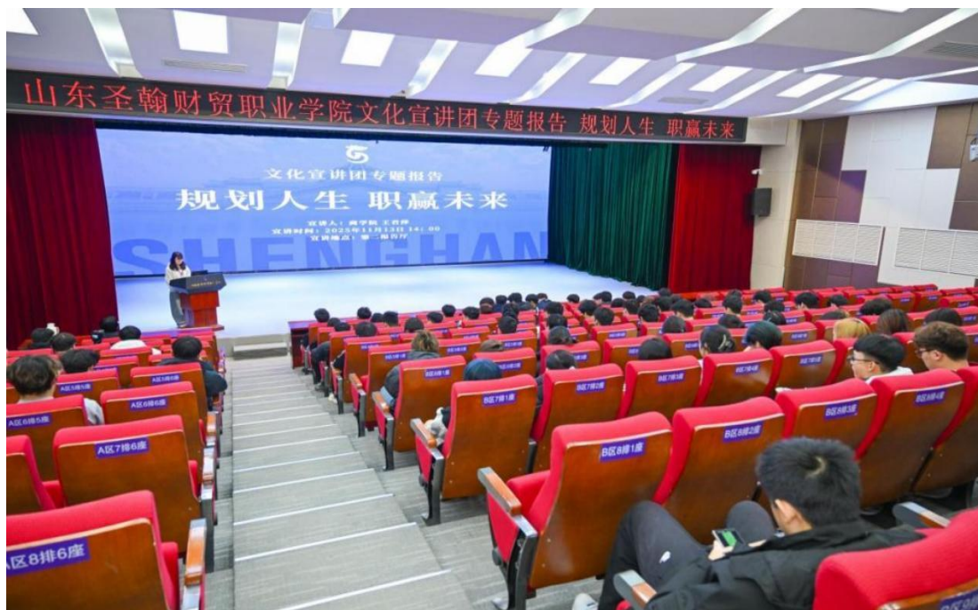
图 3-7 2025 学校文化宣讲活动现场

以“党建+专业+服务”三维融合体系为核心，云商传媒学院党支部以“光影映初心·同心谱新篇”党建活动为纽带，联合山东省电子商务协会、济南市摄影家协会走进全国文明村马套村，开展短视频拍摄培训和创意短片制作教学，助力乡村特色资源宣传。学院秉持“产教融合、服务地方”理念，将课堂延伸至农业生产一线，由师生党员组建 5 支专项服务团队，精准对接乡村需求，构建“项目驱动、实践育人、服务社会”的协同机制。在双泉豆皮品牌建设、平阴玫瑰花电商直播节等项目中，学生通过品牌策划和数字营销，不仅提升了专业技能，更培养了社会责任感和创新精神。