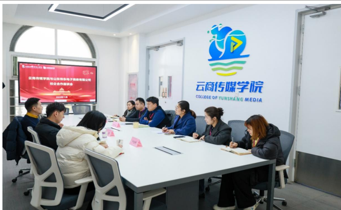
图 5-5 校企双方深度合作交流

位需求无缝对接；二是搭建实习实训基地，既可为学生提供企业沉浸式实践平台，也可探索将企业直播设备引入校园的合作模式；三是深化多元合作，包括企业专家进校园授课、指导学生技能提升，以及联合开展校内实战项目等。此外，双方还就合作实施步骤、责任分工、资源支持等细节进行了协商，明确了后续对接时间表与工作推进节点。