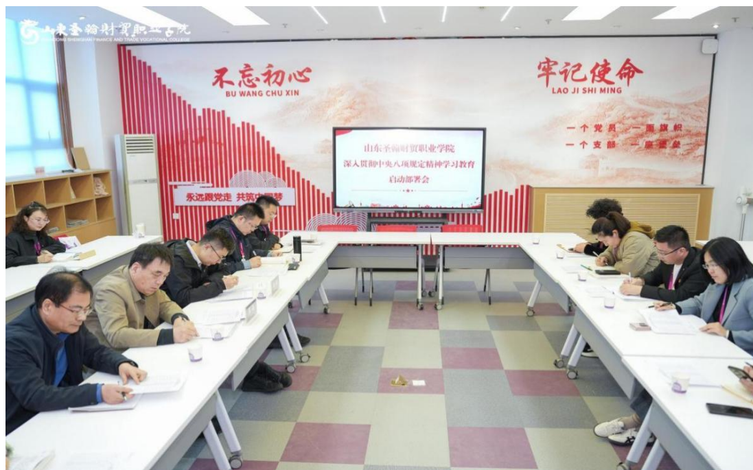
图 6-1 深入贯彻中央八项规定精神学习教育启动部署会

开门教育+建章立制、服务师生），确保学习教育取得实效。同时，坚持把意识形态建设纳入党建工作责任制，筑牢校园思想阵地。