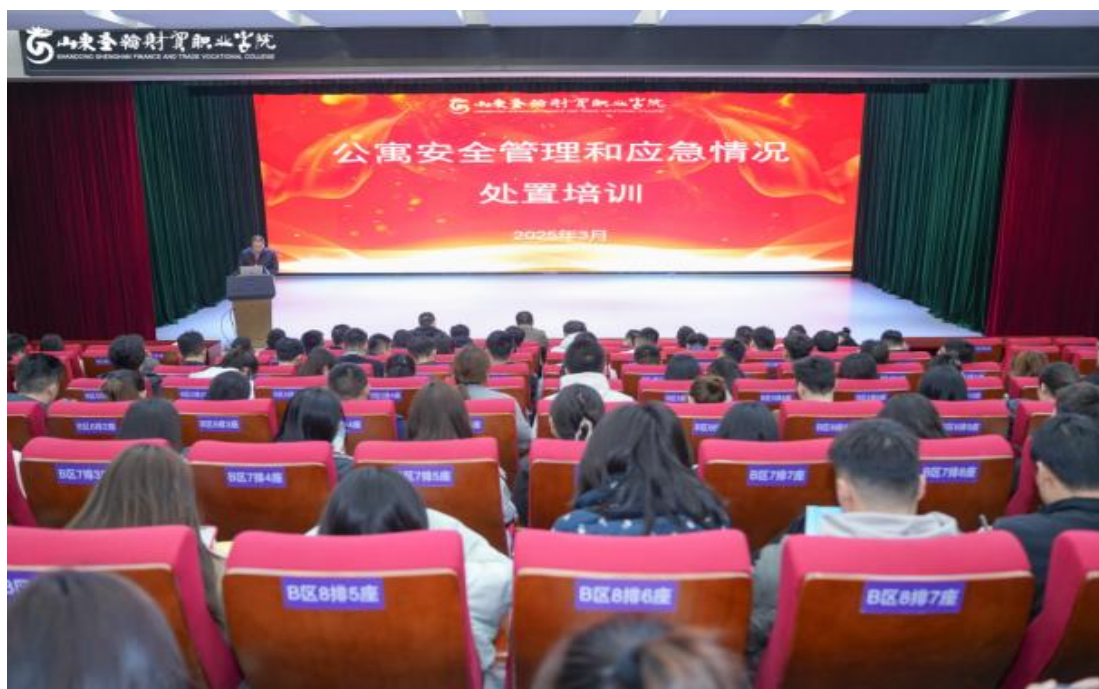
图 1-15 公寓安全管理和应急情况处置培训