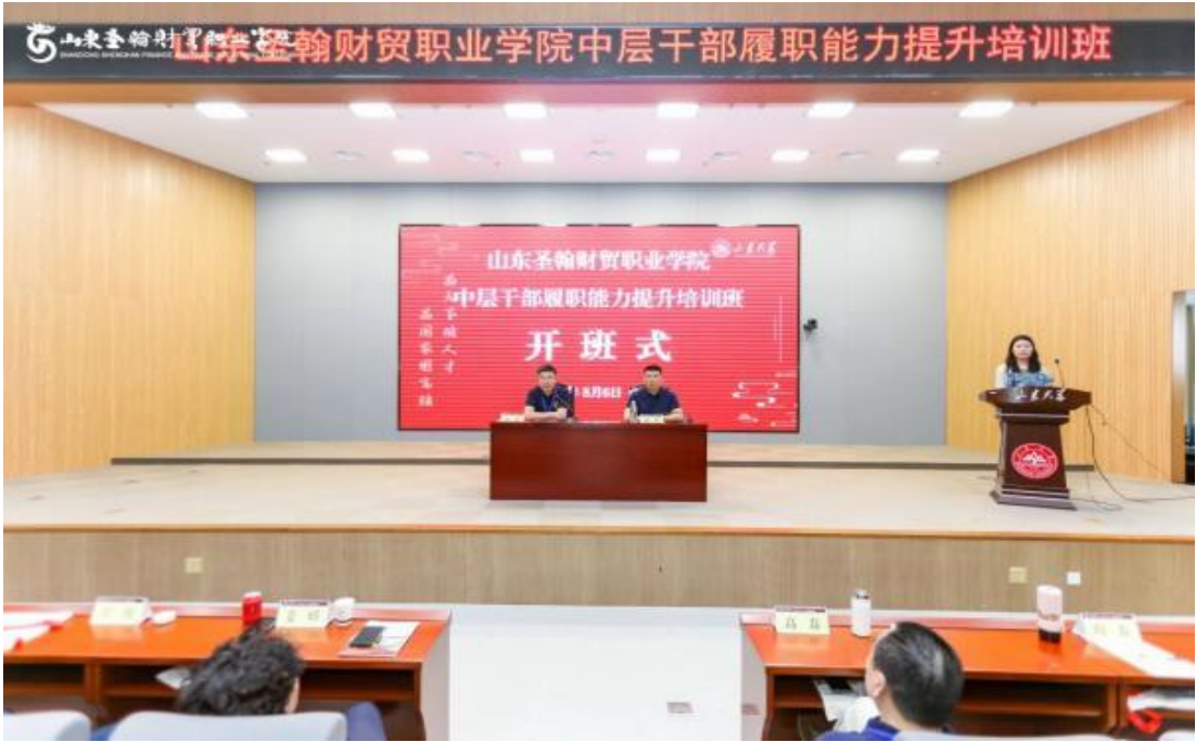
图 1-9 教师培训进修活动

学校秉持“以赛促教、以赛促学、以赛促改、以赛促建”理念，开展教学能力大赛、青年教师教学比赛、教师专业技能竞赛等活动，系统化推进教学团队建设，提升教师教学能力与业务水平。