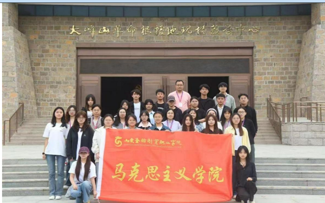
图 1-1 马克思主义学院师生走进大峰山革命教育基地

业解读文物故事；课后，紧扣全国两会等热点组织“大峰山精神照见青春之路”研讨会，组建“红色宣讲团”开展校内宣讲 12 场，覆盖 2000 余人次，成效显著，92% 学生认为实践让思政课生动可感，88% 学生对爱国主义精神理解更具体，37 名学生暑期投身大峰山周边乡村振兴服务，12 篇实践报告获评校级优秀成果，实现思政教育从“知识传授”到“知行合一”的跨越。