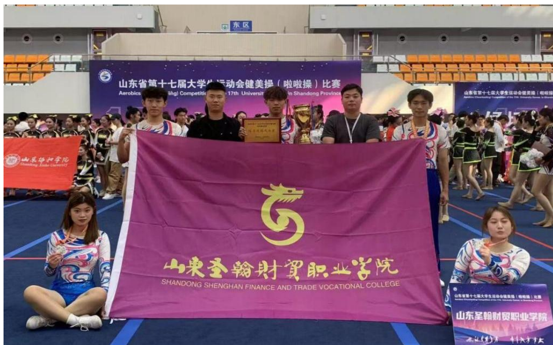
图 1-11 山东省大学生运动会健美操（啦啦操）比赛