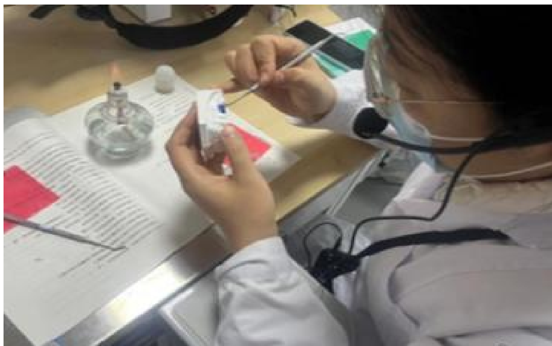
图 1-8 口腔医学技术专业滴蜡塑形实训

健康学院在口腔医学技术综合实训室开展为期一周的滴蜡塑形项目实训，夯实学生专业技能基础，提升滴蜡塑形的精准度与艺术表现力。实训前，教师制定并下发实训指导书；实训中，学生分组讨论塑形步骤、分工协作，教师巡回指导，实时解决技术难点；实训后，设置作品展示与点评环节，检验实训达成度。学生通过实训纠正错误习惯，掌握实用技巧，深化对滴蜡塑形技能的理解。