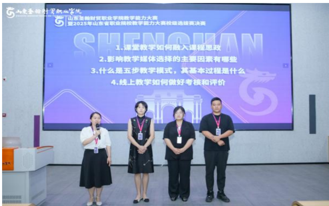
图 1-10 教师积极参加比赛