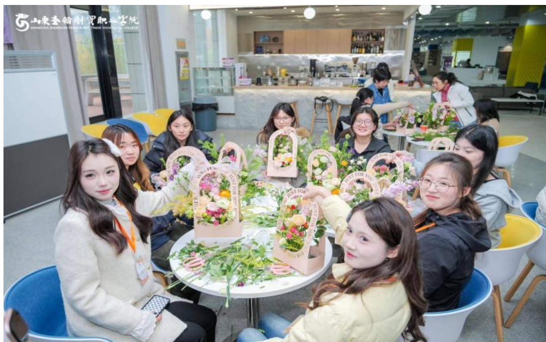
图 3-6 学生参加插花艺术活动