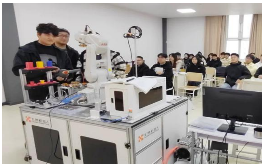
图 6-3 《工业机器人编程与仿真》课堂实训

《工业机器人编程与仿真》实训课以典型工业智能搬运为项目，任课教师下发实训指导书，现场演示机器人示教器使用方法并强调技术细节，学生按程序员、仿真员、操作员岗位业务要求，开展程序控制、验证及运行测试，在真实项目中锻炼实践能力。课程注重培养学生创新思维和工程实践能力，通过虚拟仿真和示教器实操技术提高学习效率 and 安全性，引入工业 4.0 理念，让学生充分了解智能制造系统集成、人机协作等前沿技术。