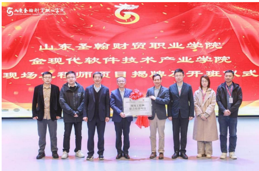
图 5-2 金现代现场工程师项目揭幕及开班仪式

信息工程学院依托金现代软件技术产业学院，实施“金现代现场工程师专项培训计划”，深化产教融合，精准对接企业需求。该项目以“三对接”（专业与产业对接、课程内容与职业标准对接、教学过程与生产过程对接）为核心理念，构建课程供应链，形成“职业标准—岗位标准—专业标准—课程标准”体系。2024 年 11 月开展的首期培训班覆盖 30 名学生，完成 400 学时培训（企业讲师授课 2 周、校内教师授课 3 周），内容涵盖前后端技术栈、云服务器配置、权限管理等实战技能。