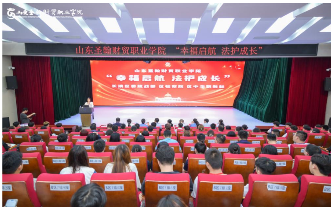
图 1-5 “幸福起航 法护成长”法治宣传教育活动

学校以“自然+专业+心理”三维育人模式为指导，构建全方位心理健康教育体系。一是深化资源融合，整合校园环境、院系专业特色与心理健康教育理论，聚焦知识普及、积极心理品质培育等四大任务，强化家校社协同；二是搭建活动体系，基础项目涵盖知识讲座、心理咨询科普、主题班会、定制化团体辅导，创新项目包括分学院专业特色工作坊、“校园环境打卡”“心灵能量站”等；三是凸显育人成效，推动教育场域向自然环境、专业实训场景延伸，提升心理健康教育的针对性与实效性，促进学生心理成长。