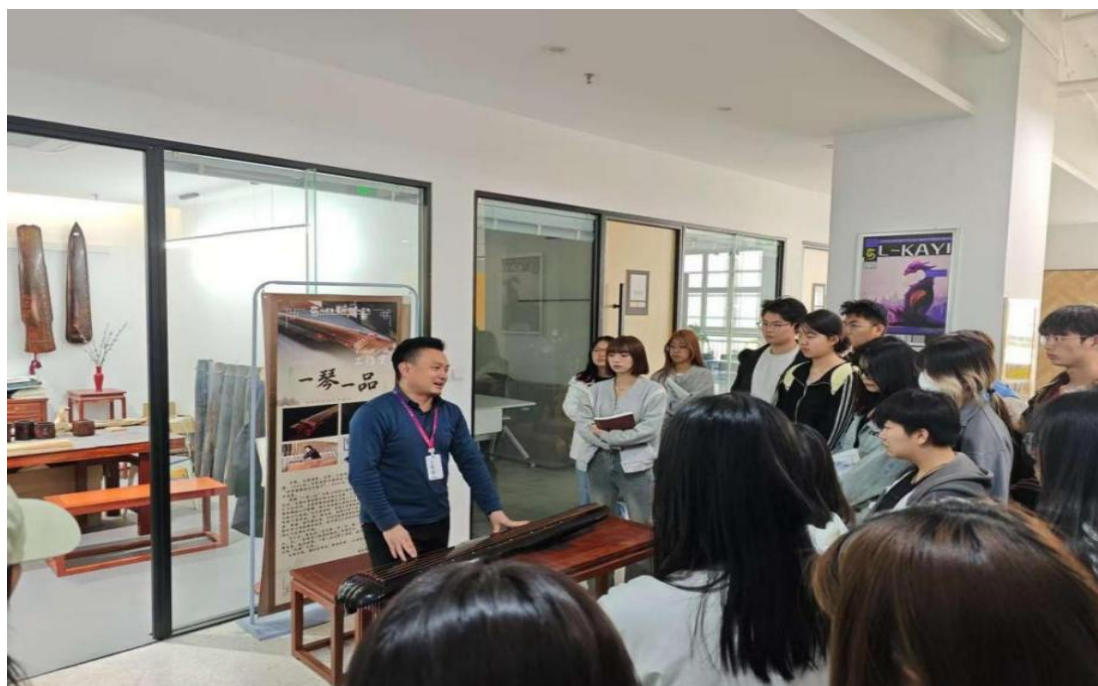
图 3-5 古琴传承人实践教学指导学生了解古琴制作工艺

以非遗技艺传承筑牢文化自信，以德技并修培育时代新人。依托省级非遗平台，构建“书法修身、剪纸传情、古琴养性”三大课程体系，开发“技艺习得—文化感悟—品德提升”渐进式培养路径，年均开展公益课堂、集训 120 余场。覆盖全校 90%专业，学员获市、省级以上奖项 10 余项，形成“三艺三品”文化育人矩阵。