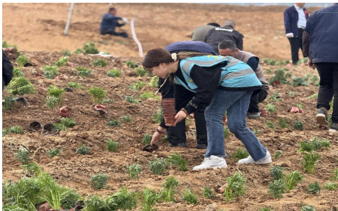
图 1-2 “青春护绿，你我同行”植树栽花志愿活动

2025 年 3 月，在第 47 个中国植树节来临之际，学校校级组织开展“青春护绿，你我同行”植树栽花志愿活动。志愿者在团委带领下分工协作，体验劳动、学习种植技能，为校园添绿。活动既美化了校园环境，又增强了学生环保意识与团队协作能力，助力学生全面发展。