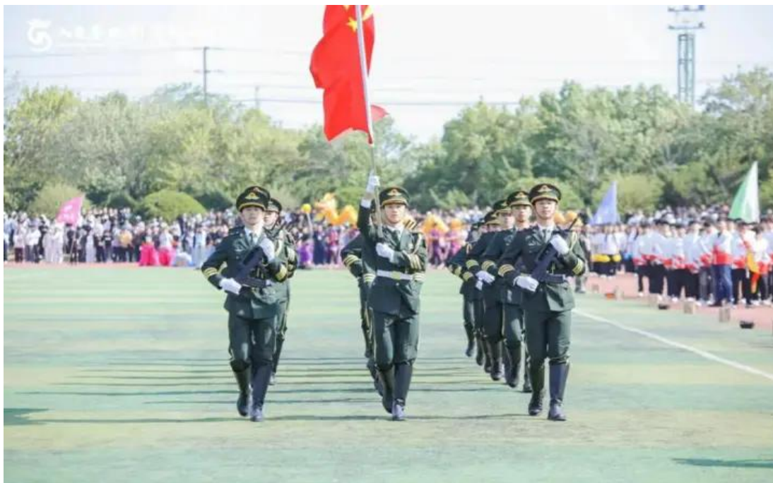
图 1-17 荣获山东省高校大学生国旗护卫队比赛团体二等奖

学校国旗护卫队在山东省高校大学生国旗护卫队展示比赛落幕，获团体二等奖。活动激发了大学生投身军营的热情，国旗护卫队将继续秉承“人民有信仰，国家有力量，民族有希望”的理念，捍卫国旗尊严，以赤诚丹心与青春热血谱写国旗礼赞。