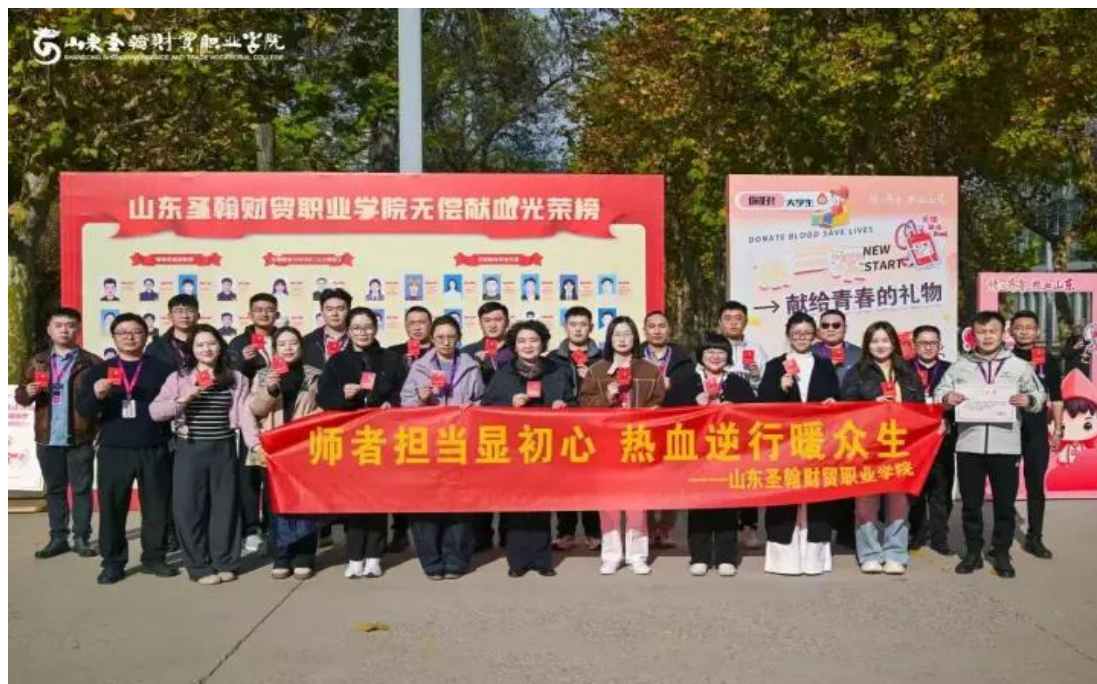
图 1-16 无偿献血活动

“先进集体”，7 名同志获“先进个人”，22 名学生获“爱心大学生”荣誉称号。此项工作被山东省齐鲁频道、济南市广播电视台报道，学校自 2012 年起连续 13 年开展无偿献血活动，累计 8869 名师生参与，献血总量达 279.56 万毫升，展现了新时代圣翰学子的责任与担当。