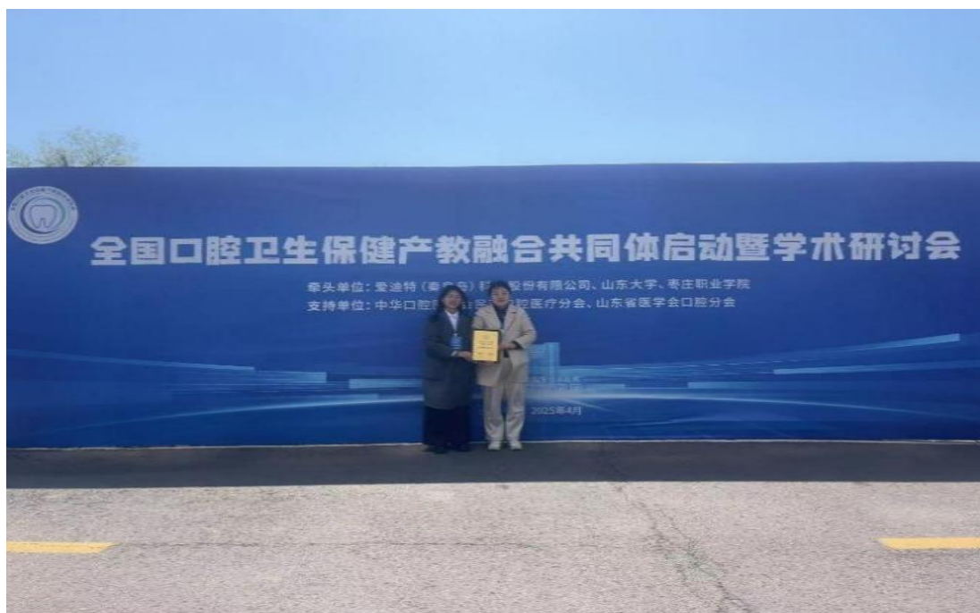
图 5-4 学校参加全国口腔卫生保健产教融合共同体活动