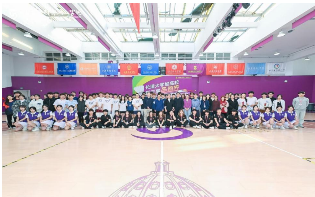
图 1-12 举办长清大学城高校“圣翰杯”羽毛球邀请赛

学校持续举办长清大学城高校“圣翰杯”羽毛球邀请赛，来自 13 所高校的 100 余名运动员参赛，设男子单打、男子双打、女子单打、女子双打、混合双打五个项目。活动促进了驻地高校交流融合，引导学生积极参与体育锻炼，增强身体素质，增进兄弟院校师生友谊，是一次广泛参与、高水平的团结友谊盛会。