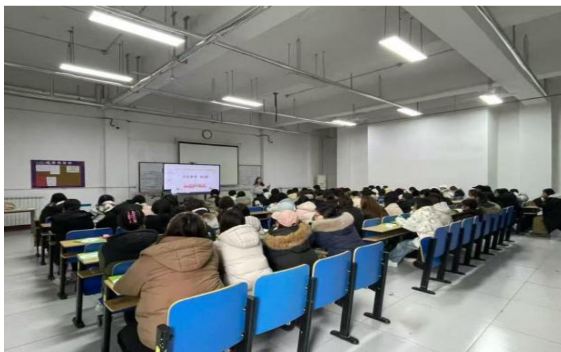
图 1-19 学生参加教师资格证培训

考证主动性，化解时间冲突等问题。2025 届毕业生累计获取职业类证书 2500 余本，较 2024 届（514 本）增长近 400%，人才培养质量得到有力彰显。学校梳理形成《学院专业与大学生核心必备职业证书适配指导目录》《学院专业与〈国家职业资格目录证书〉（2021）适配指导目录》，明确普通话证书、计算机二级证书等精准匹配规则，避免盲目报考。