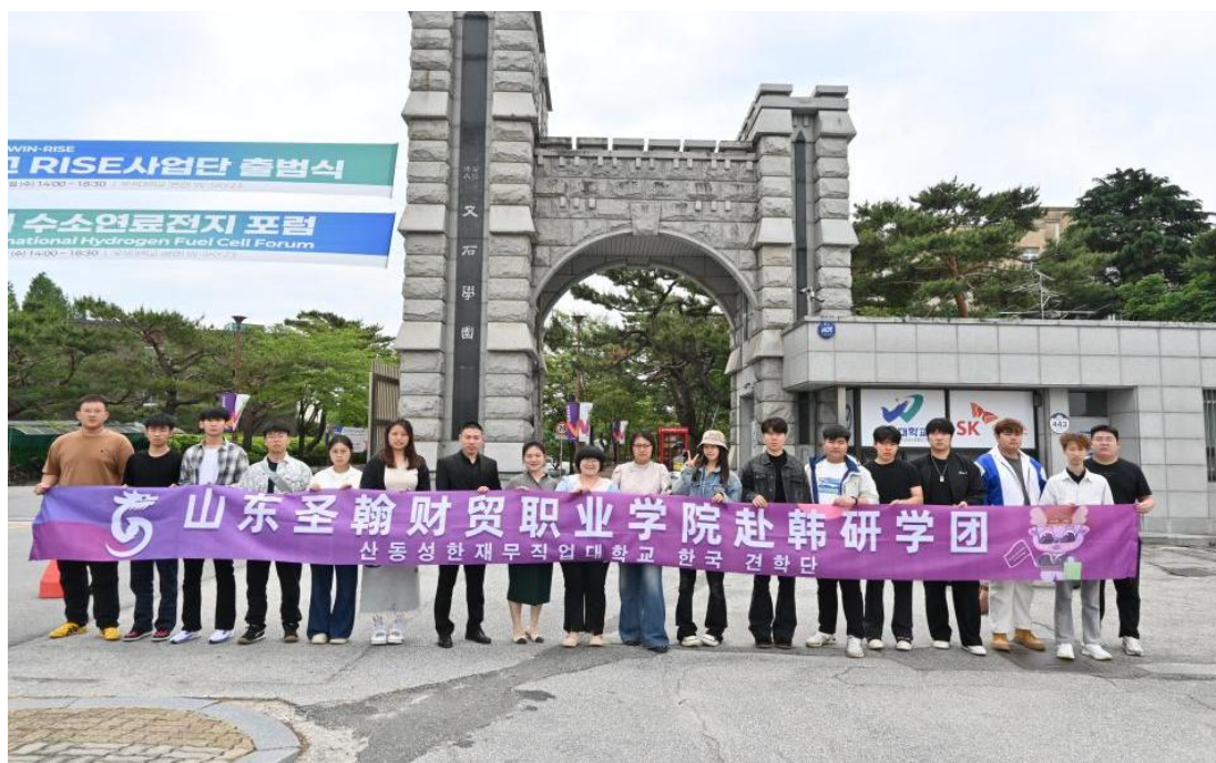
图 4-3 学生赴韩国又石大学研学