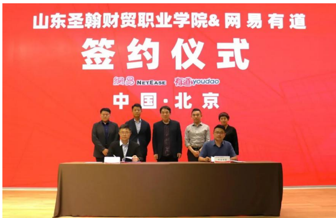
图 5-3 学校与网易有道信息技术（北京）有限公司 共建产业学院签约仪式