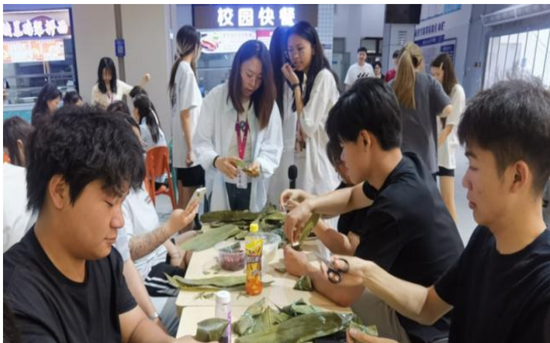
图 3-1 “浓情端午 粽趣横生”包粽活动

学校紧扣医美专业“手法精准、审美敏锐”特质,以“专业融合”为核心打造端午包粽课程,实现传统文化与专业教育深度耦合。课程采用“线上溯源+沉浸式实操+专业拓展”三维模式:课前推送定制资料,关联“饮食美学与医美审美的共通性”;课中设传统区(非遗传承人传授包粽技艺)与专业创新区(学生用镊子摆馅、调彩色糯米);课后布置“端午文化与医美服务”探究作业。成效显著:85%学生手部操作稳定性提升,迁移至专业实训后失误率降12%;93%学生认为课程让传统文化从“知识”变“体验”。