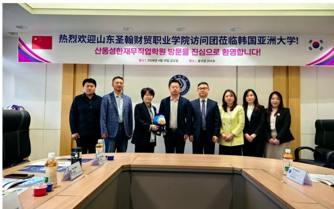
图 4-1 学校代表团访问韩国亚洲大学

学院、管理发展学院等 9 所高校建立友好合作关系，达成联合培养、师生互访、资源共享等合作共识。二是“请进来”深化合作层次。接待韩国又石大学、岭南大学及德国多普福国际学院等 3 所高校来访，就合作办学、课程共建、实训基地共享等议题开展专题研讨，推动双方合作从“友好往来”向“实体化合作”转型。