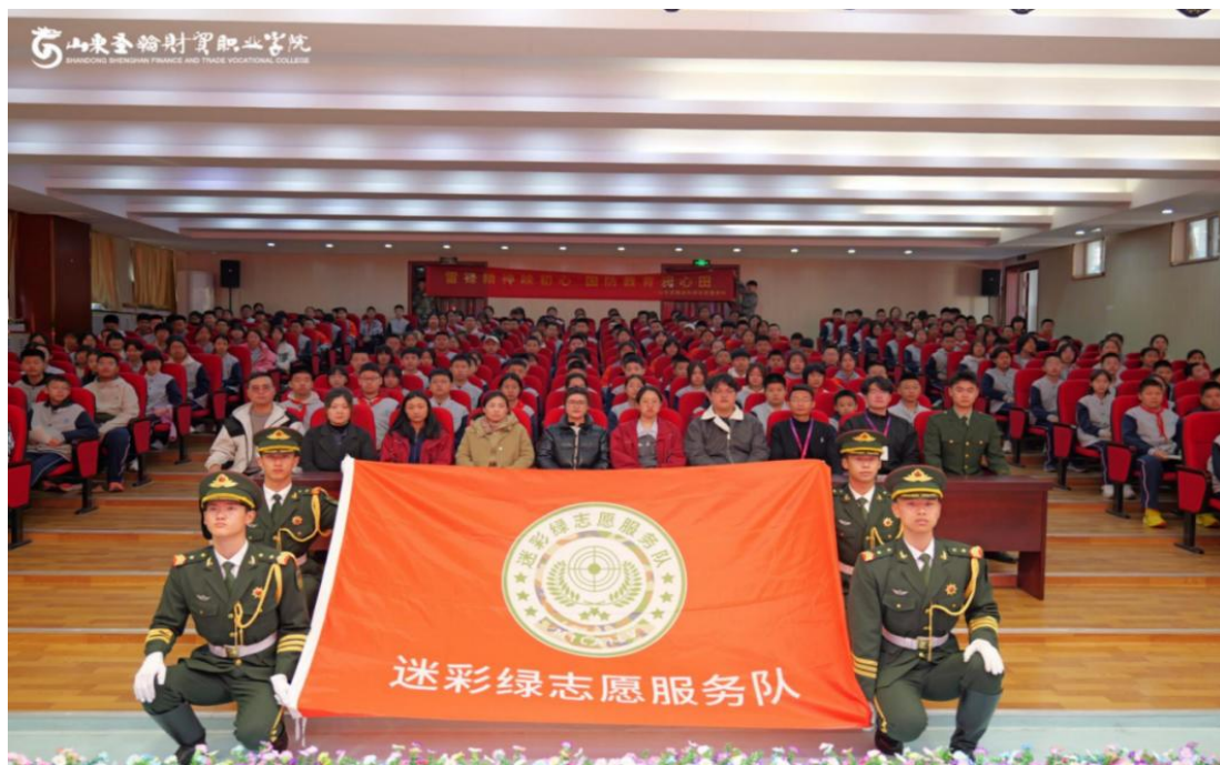
图 3-4 迷彩绿志愿服务队走进长清湖实验学校