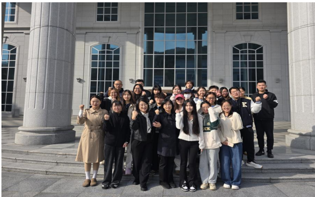
图 4-2 学校教师赴韩国庆云大学学习