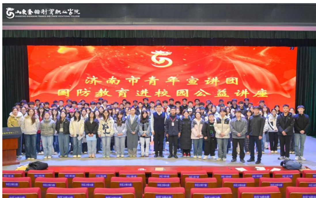
图 3-3 国防教育进校园公益讲座